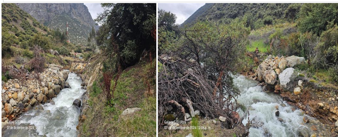
FOTOGRAFIA 02: Vista en la que se aprecia la carencia de diques secos con acumulacion de material propio en ambas margenes de la QDA. QUICHAS.