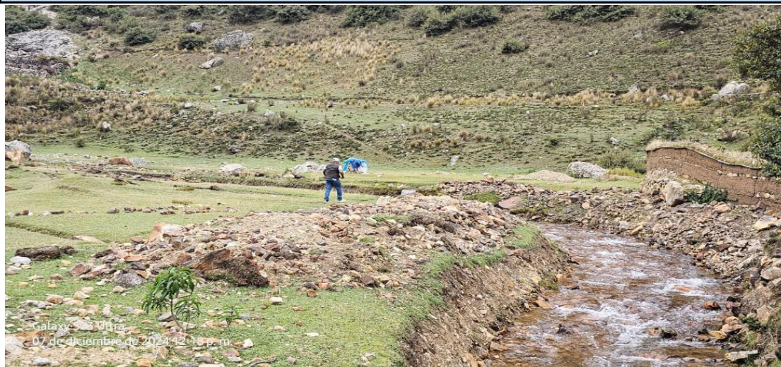
FOTOGRAFIA 01: Vista en la que se aprecia el cauce de la quebrada, la cual se encuentra colmatada, producto de las máximas avenidas.